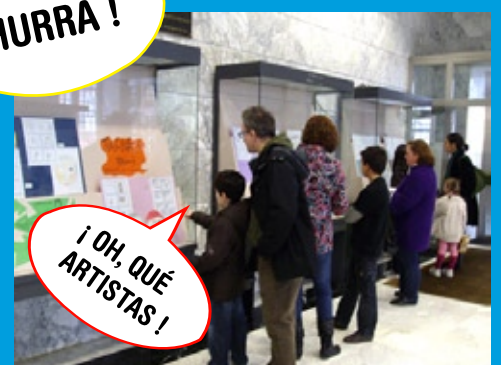
Exposición "Como se fai un cómic" en el vestíbulo de la Biblioteca