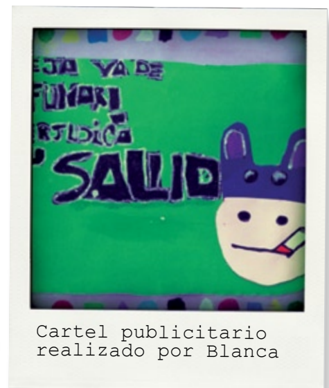
Cartel publicitario realizado por Blanca