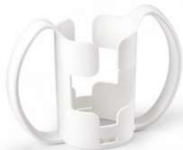
Asas de agarre para vaso