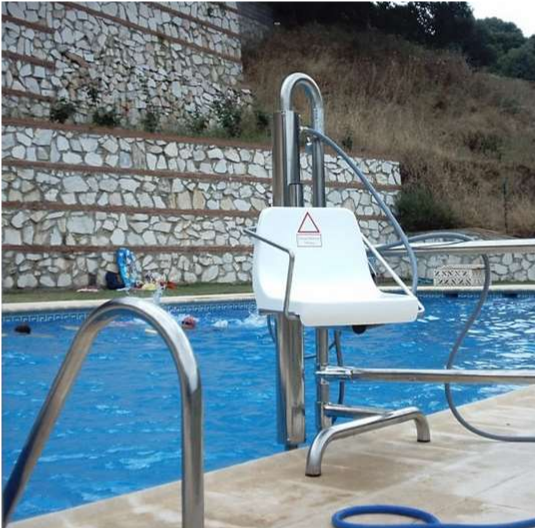
Grúa para piscina

Ante a imposibilidade de facer accesible por medios arquitectónicos unha piscina ou por falta de espazo, existen grúas para piscina.