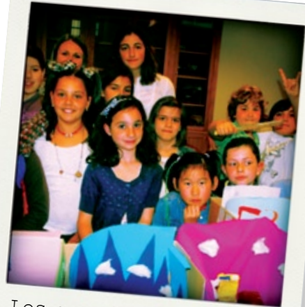
Los participantes en el taller de ilustración

*Para sacar el polo del molde, vuélvelo del revés y ponlo bajo el grifo.