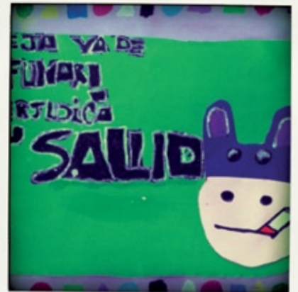
Cartel publicitario realizado por Blanca