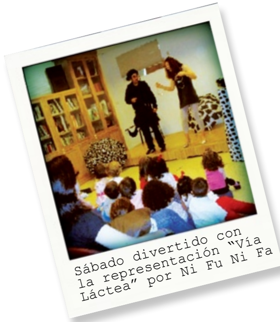
Sábado divertido con la representación "Vía Láctea" por Ni Fu Ni Fa