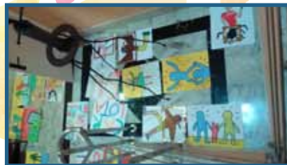
A Biblioteca énchese de arte