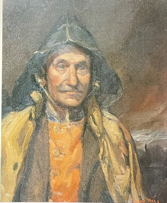
Marihero, cá. 1940. Oleo doado por Isaac Díaz Pardo. Inventario de patrimonio nº199

PARTE OFICIAL S. M. el Rey D. Alfonso XIII (que Dios guarde), S. M. la Reina Doña Victoria Eugenia, S. A. R. el Príncipe de Asturias e Infantes y demás personas de la Augusta Real Familia, continúan sin novedad en su importante salud. (Gaceta del 19.) Administración central MINISTERIO DE FOMENTO REAL ORDEN Núm. 324.