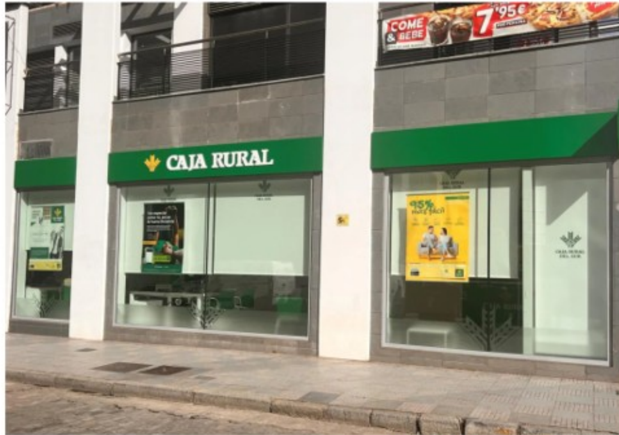
Una entidad de Caja Rural en una imagen de archivo

La agencia destaca que Caja Rural del Sur cuenta con métricas financieras sólidas